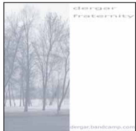
Το εξώφυλλο του Fraternity.

ικανοποιεί, να αντιλαμβάνεσαι ότι αγγίζει και άλλους. Επίσης θέλω να συνεχίσω να απολαμβάνω τη μαγεία της δημιουργίας της μουσικής. Για όσους μπουν στην ισοσελίδα μου, θα με ενδιέφερε μια άμεση επικοινωνία, ένα feedback, κάποιο σχόλιο ακόμα και αρνητικό.