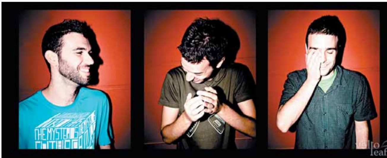
Οι Χανιώτες κατά τα 2/3 Vello Leaf.

ΑΡΝΗΤΙΚΟ ΣΧΟΛΙΟ: Δεν είχαμε κάτι που να μας ενόχλησε. Μάλλον είναι ευγενικοί μαζί μας (γέλια). Τα σχόλια αδιαφορίας ίσως κάπου ενοχλούν, μπορεί κάποιος να πει