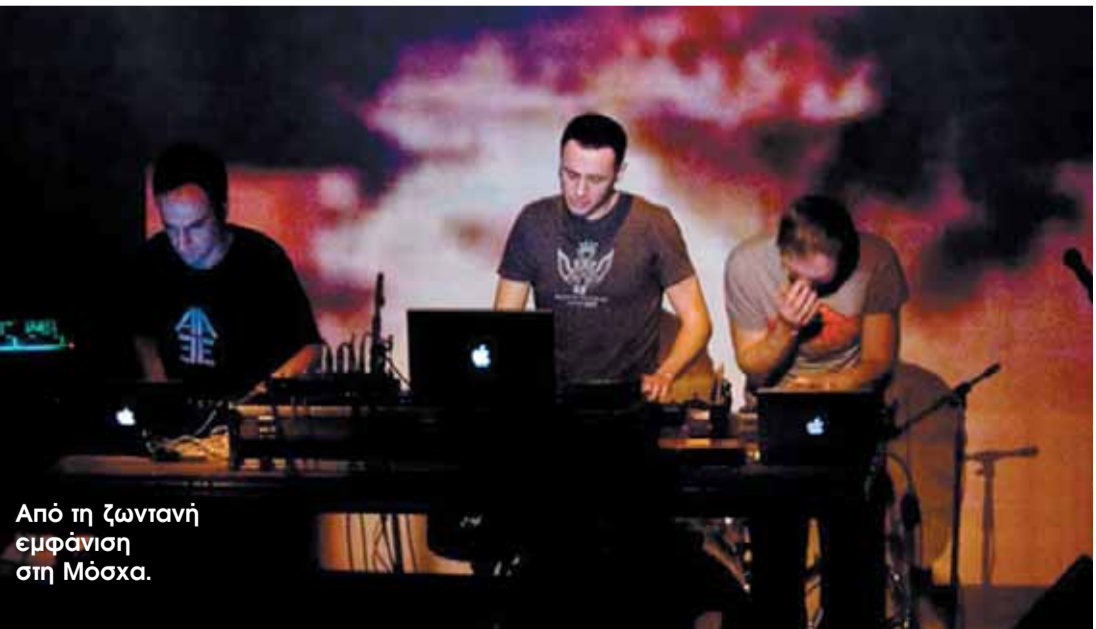
Από τη ζωντανή εμφάνιση στη Μόσχα.

ικανοποιεί, να αντιλαμβάνεσαι ότι αγγίζει και άλλους. Επίσης θέλω να συνεχίσω να απολαμβάνω τη μαγεία της δημιουργίας της μουσικής. Για όσους μπουν στην ισοσελίδα μου, θα με ενδιέφερε μια άμεση επικοινωνία, ένα feedback, κάποιο σχόλιο ακόμα και αρνητικό.