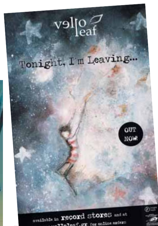
Η τελευταία δουλειά των Vello με τίτλο "Tonight I'm leaving..."

καθώς γίνεται πολύ μεγάλη δουλειά από πολλά συγκροτήματα, διαφόρων ειδών και κυκλοφορούν ανεξάρτητα πολύ καλές προσπάθειες. Υπάρχουν πολλές προσπάθειες που αξίζει να ανακαλύψει κανείς και... ίσως μια από αυτές να είμαστε και εμείς.